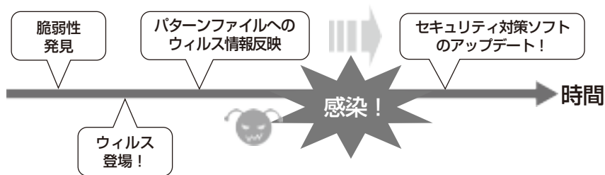
図 4-1 セキュリティ対策ソフトのアップデート前に感染する流れ

パターンファイルを更新するタイミングより、新しいマルウェアの侵入が早い場合には検出することができません。