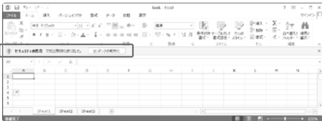
画像 4-1 マクロ機能の有効 / 無効を設定する画面

マクロウイルス対策として、Excel や Word では、マクロを含むデータを開く場合は、マクロを有効にするか無効にするかの確認を行います。マクロ機能を無効にすることによりマクロウイルスの活動を制限できます。